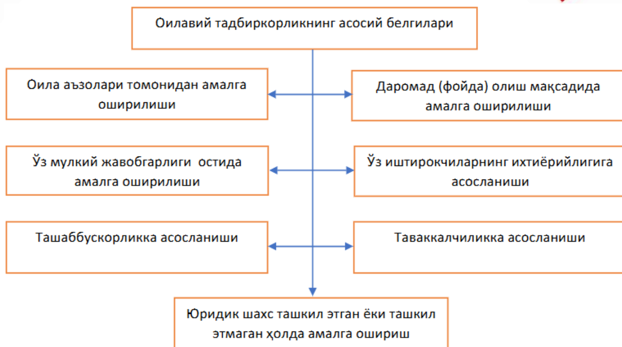
1-расм. Ўзбекистонда оилавий тадбиркорликнинг асосий белгилари 16

Охириги йилларда оилавий корхоналар фаолиятини қўллаб-қувватлаш ва ривожлантириш борасида ҳукумат томонидан муҳим чора-тадбирлар ва дастурлар қабул қилинди. Улар жумласига мамлакат Президентининг 2018 йил 7 июндаги "Ҳар бир оила -тадбиркор" дастурини амалга ошириш тўғрисида"ги ПҚ-3777-сон қарори, 2020 йил 13 октябрдаги "Аҳолини тадбиркорликка жалб қилиш тизимини такомиллаштириш ва тадбиркорликни ривожлантиришга доир қўшимча чора-тадбирлар тўғрисида"ги ПҚ-4862-сон қарори, 2021 йил 27 мартдаги "Оилавий тадбиркорликни ривожлантириш давлат дастурлари доирасида амалга ошириладиган қўшимча чора-тадбирлар тўғрисида"ги ПҚ-5041-сон қарори, 2017 йил 7 февралда "Ўзбекистон Республикасини янада ривожлантириш бўйича Ҳаракатлар стратегияси тўғрисида"ги фармонида кўзда тутилган мамлакатни 2017-2021 йилларда ривожлантиришнинг бешта устувор йўналишлари бўйича ҳаракатлар стратегияси, Ўзбекистон Республикаси Президентининг 2018 йил 7 июнь куни "Ҳар бир оила —тадбиркор" дастурини амалга ошириш тўғрисида"ги қарорни имзолади. 2018 йил 14 июлда Ўзбекистон Республикаси Президентининг бевосита ушбу масалага дахлдор бўлган "Аҳоли бандлигини таъминлаш борасидаги ишларни такомиллаштириш ва самарадорлигини ошириш чора-тадбирлари тўғрисида"ги қарори қабул қилинди.