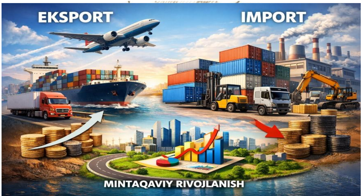
1-rasm. eksport va import jarayonlari

Ushbu rasmda eksport va import jarayonlari tasvirlangan. Chap tomonda samolyot, kema va yuk mashinalari orqali mahsulotlarni boshqa davlatlarga eksport qilish ko'rsatilgan, bu esa mamlakat iqtisodiyotiga daromad keltiradi (pul staklari bilan